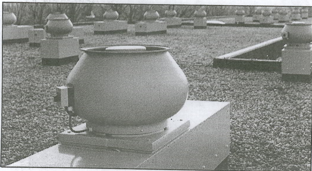
De mechanische afzuiging van verzorgingstehuis is sterk verbeterd door geluiddempende kasten en ventilatoren

Met de renovatie van de aanleunwoningen is f 6,5 miljoen gemoeid en met die van het verzorgingstehuis f 1,5 miljoen. Het geheel is gerealiseerd door Aannemingsbedrijf Van Straten BV. De installatie is verzorgd door installateur