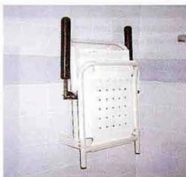
De badkamers zijn ruim en geschikt voor rolstoelers en voorzien van een vast douchezitje en beugels bij de toiletspot