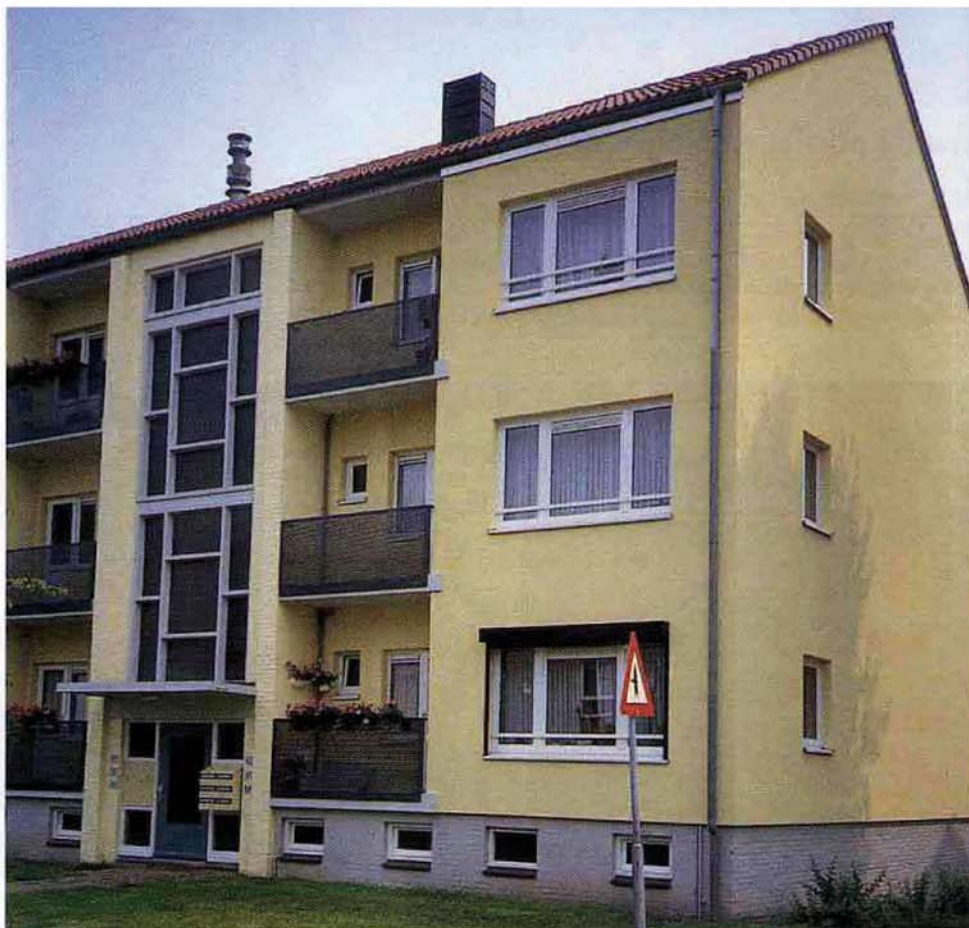
De balkonhekken met een groot wafelmotief van betonnen elementen zijn vervangen door meer eigentijdse geperforeerde staalplaten.