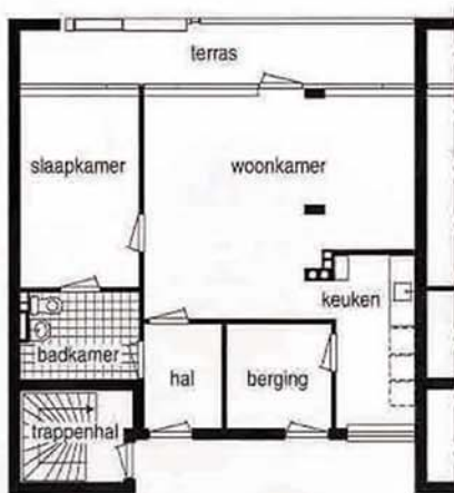
De plattegrond van de bestaande bebouwing heeft qua indeling geen wijzigingen ondergaan.

te differentiëren. Ook schiep nieuwbouw de mogelijkheid om het terrein anders in te richten. Het wijkcentrum werd eveneens gesloopt. Het nieuwe dienstencentrum is ondergebracht in gebouw A van de nieuwbouw. De nieuwe woningen verschillen in oppervlak en afwerking en bieden de bewoners meer woongenot dan de bestaande. Een van de redenen is dat de woningen beter bereikbaar zijn geworden •