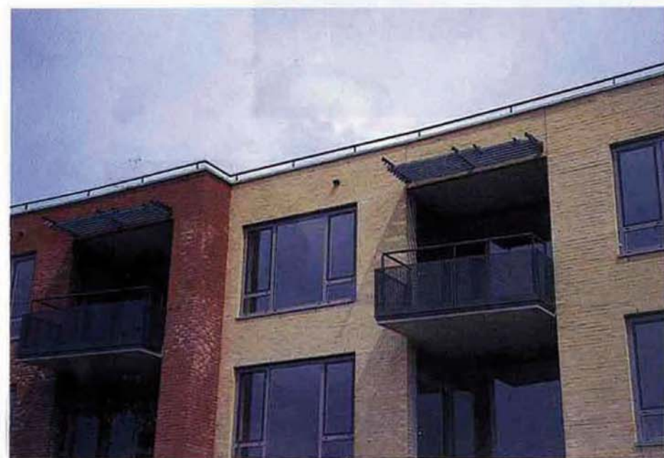
Om het uiterlijk van de nieuwe gele stenen gevels te verlevendigen zijn de hoeken van het gebouw uitgevoerd in rode steen.