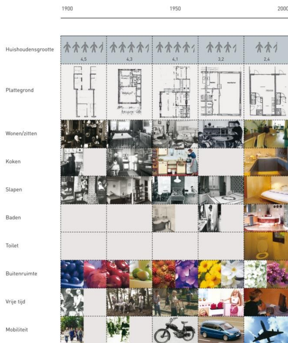
De ontwikkelingen in wonen, vrije tijd en mobiliteit over de periode 1900-2000

De internationale bouwbeurs van februari 2011 in Utrecht heeft de vragen op de renovatiemarkt nieuw perspectief geboden. Diverse nieuwe renovatieconcepten zijn op de beurs of tijdens studiebijeenkomsten aan de bezoekers gepresenteerd. Een vijftal zullen in dit artikel nader beschouwd worden, omdat we als auteurs erbij betrokken zijn. En alle betrokkenen deel uitmaken van het netwerk 'Conceptueel Bouwen'. Dit platform heeft ervoor gezorgd dat marktpartijen elkaar gevonden hebben bij het zoeken naar innovatieve oplossingen, zowel qua proces als product. In die zin leven we op dit moment in een spannende transformatieperiode, waarbij dingen mogelijk zijn die tien jaar geleden nog tot de onmogelijkheid behoorden. Juist de samenwerking vanuit verschillende posities levert totaal nieuwe gezichtspunten op.