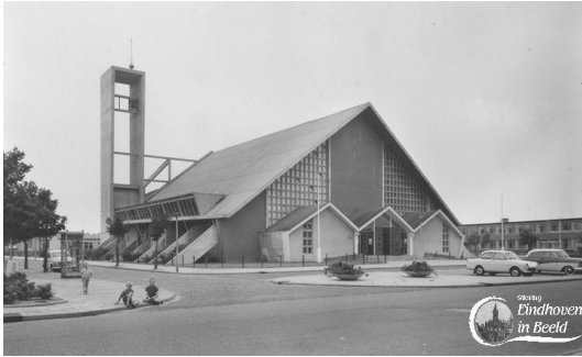
Pius X kerk Eindhoven originele situatie (1960)

De winkelcentra van de jaren zestig kenmerken zich door een eigen eenheid, enigszins los van de rest van de wijk en op zichzelf staand. Het is geen straatwand meer van de wijk (een strip). De ontwikkeling van deze winkelcentra is tweeledig: of het wordt gesloopt en misschien blijft de supermarkt over, of het winkelcentrum wordt versterkt. In alle gevallen wordt de transformatie vaak begeleid door extra hoogbouw ter plaatse van het winkelcentrum.