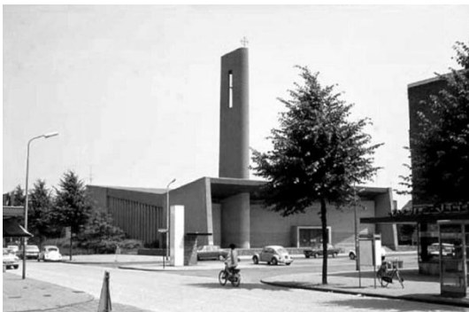
Judas Tadeuskerk Eindhoven originele situatie (1968)

Hetzelfde geldt voor de schoolgebouwen, die versneld verdwijnen. Men vergeet dat kerken en schoolgebouwen essentiële onderdelen zijn van het collectieve geheugen. Veel bewoners hebben er een relatie mee. En alleen daarom al zouden we er extra zorgvuldig mee om moeten gaan. Wil een buurt of wijk een plek worden om te wonen, dan zal er ruimte moeten zijn voor dit geheugen.