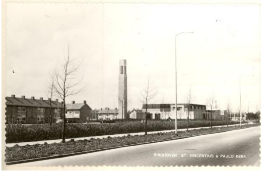
St. Vincentius a Paolo Eindhoven originele situatie