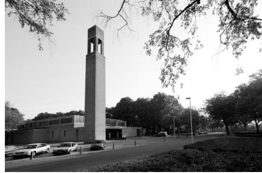
St. Vincentius a Paolo Eindhoven huidige situatie (2011)