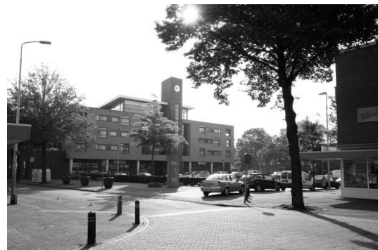
Judas Tadeuskerk Eindhoven huidige situatie (2011)