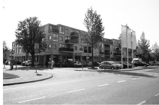
Pius X kerk Eindhoven bestaande situatie (2011)