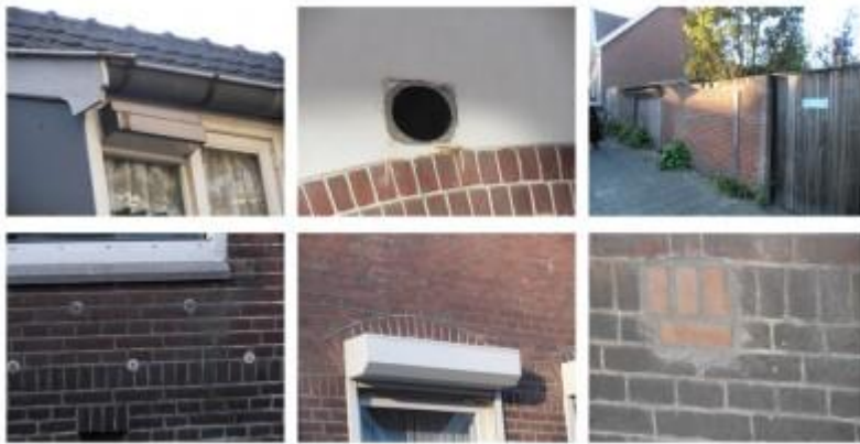
Verstoringsen Philipsdorp, gefotografeerd door bewoners

De bewoner kent zijn omgeving en wordt dagelijks geconfronteerd met de dingen die karakteristiek zijn, een positieve herkenning oproepen of die als storend ervaren worden. Een belangrijke stap voor de ontwikkeling van een beeldkwaliteitsplan voor een buurt of wijk is om die zaken in kaart te brengen. Bijvoorbeeld door middel van foto's van de karakteristieke en storende elementen. Juist hier ligt een belangrijke rol weggelegd voor de bewoners. Tegelijkertijd is het nodig de stedenbouwkundige en architectonische kwaliteit te duiden en te waarderen. Juist door de verbinding van de (persoonlijke) ervaring van de bewoner en de geduide structuur van een betrokken deskundige, krijgen er uiteenlopende persoonlijke verhalen verbanden, die vertaald kunnen worden naar een beeldkwaliteitsplan, dat aansluit bij het wonen.