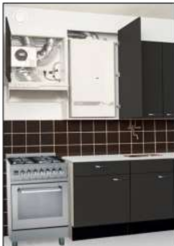
Alliantie+ (vanaf 2009)